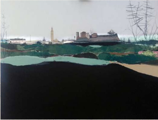
1º Premio-Eduardo Gómez Query