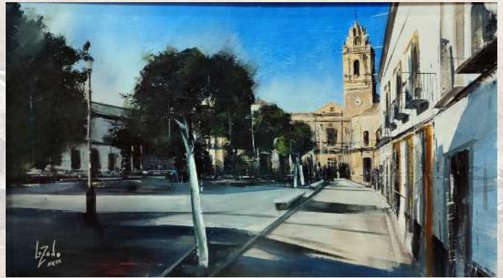
6º Premio-Manuel Fernández Lozano